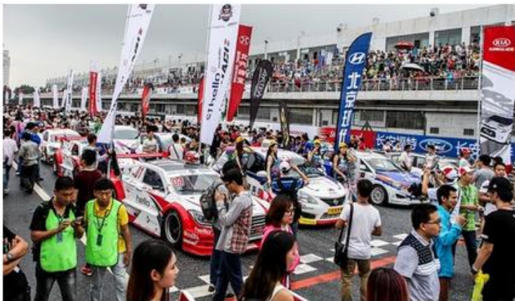
2015 CTCC肇庆揭幕站盛况空前。

新华网广东肇庆8月13日专电（记者张千里）长城润滑油CTCC中国房车锦标赛将于8月14日至16日再度回到位于肇庆的广东国际赛车场，展开本年度第五站的较量。作为下半程的第一场硬仗，本场比赛也将决定谁能在下半赛季夺得先机，在总冠军之战中占据主动。